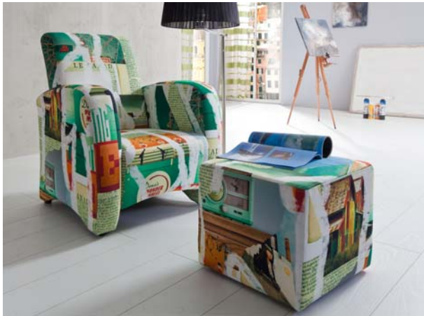
Sessel Manca und Pur-Hocker-2