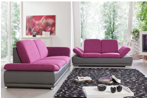
Modell Salda mit verstellbaren Armlehnen Korpus Novello Soft schlammgrau Sitz, Rücken und Armlehnen Break pink